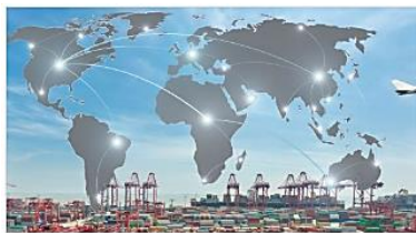
Supply Chain Management

Auf der Grundlage branchenspezifischer Fachexpertise decken wir ein breites Portfolio an Beratungsthemen in Supply Chain Management, Logistik, Produktion, After Sales, Fabrik und Lager sowie Einkauf und Beschaffung ab.