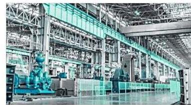
Fabrik- und Lagerplanung