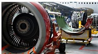
After Sales Management