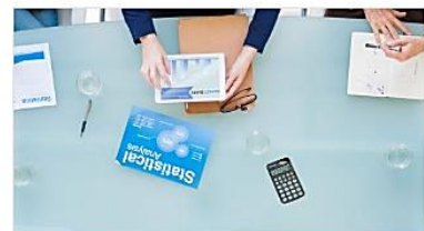
Einkauf und Beschaffung

Das reicht von der Entwicklung individueller Strategien über das Design und die Optimierung von Prozessen bis hin zur Definition von Anforderungen an unterstützende IT-Systeme und die Anwendungskonzeption. In den meisten Projekten unterstützen wir unsere Kunden aktiv in der Umsetzungs- und Realisierungsphase.